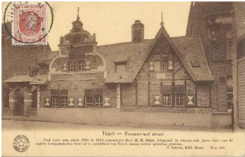
Vermoedelijk oudste afbeelding