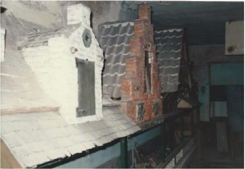
rond 1980

Opening van "Oud Thielt" In de Krommewalstraat Prachtige zaal. Zichten & panorama's voorstellende Thielt in de 16 de en 17 de eeuw Afwisselende aantrekkelijkheden Oudheidkundig museum Vermakelijke en nuttige Cinemavertoningen